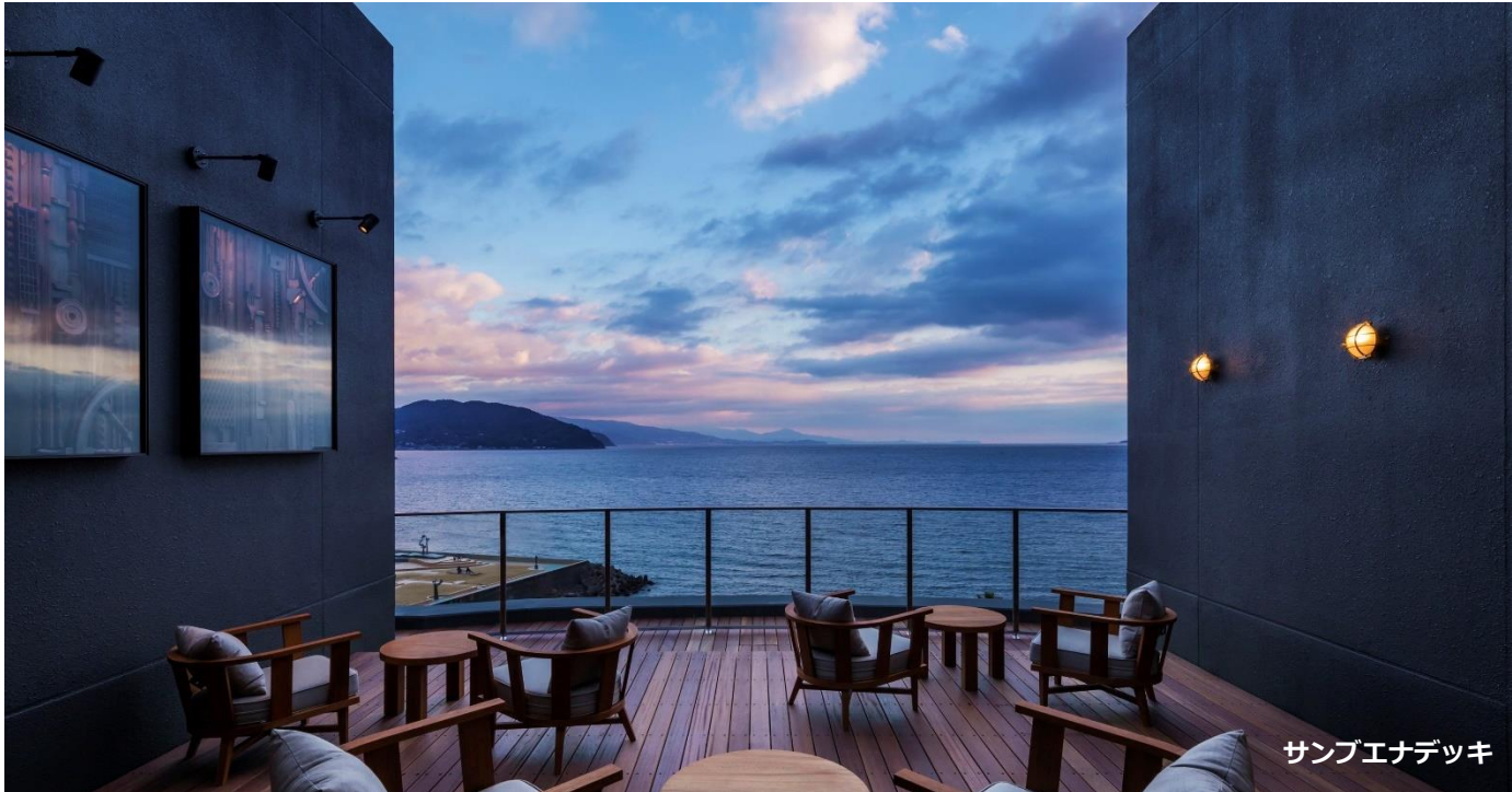
サンブエナデッキ

星野リゾート（所在地：長野県北佐久郡軽井沢町・代表：星野佳路）は、2017年4月13日（木）に、「星野リゾート 界 アンジン」（所在地：静岡県伊東市）を開業します。界 アンジンが建つ伊東市は、英国人航海士ウィリアム・アダムス（後に三浦按針）による日本初の西洋式帆船が造船された地であり、その歴史にちなみ、随所に海や船旅をテーマにしたデザインが施されています。館内のインテリアデザインは、設計事務所・スーパーポテトが手掛けています。地上8階建て・客室数全45室の施設で、星野リゾートが運営する温泉旅館「界」としては、14軒目となります。