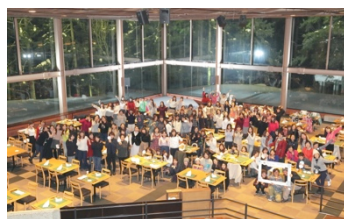
▲2017年3月1日 イベントに参加した「雪ガール」