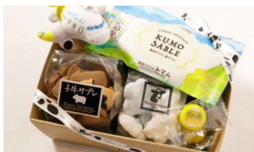
▲2017年3月1日 ウェルカムお菓子セット