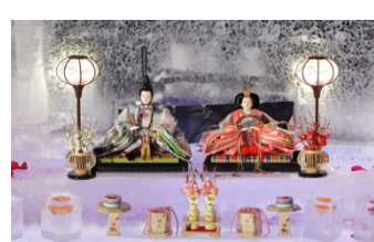
▲2017年3月2日 「氷のひなまつり」