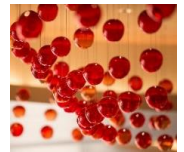
津軽びいどろの りんごの実