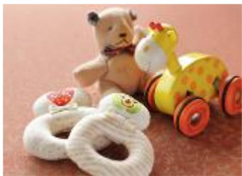
荷物の負担を軽くする、お子様向けの貸し出し備品

お子様連れの旅行は荷物が多くなりがち。そこで全ての「界」にて、ベビー&キッズ向けのアイテムを用意し、荷物へのストレスを極力なくしていただけるようサポートしています。