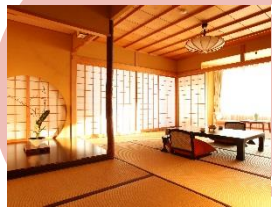
ベビーものびのび過ごせる 安心の畳の客室

裸足でも安心な畳のお部屋、好きな時間に入れる露天風呂付き客室。ベビーのお着替えにも便利な場所を備えた大浴場、家族水入らずで食事を楽しめる半個室の食事処など。「界」ではさらにスタッフも強力サポートし、大切な温泉旅館デビューの旅を、快適で心地よいものにします。