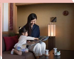
旅の書籍や絵本が揃う トラベルライブラリー