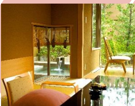
いつでも気兼ねなく入れる 露天風呂付きの客室