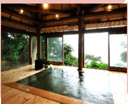
ベビーのお着替えスペースも備えた大浴場