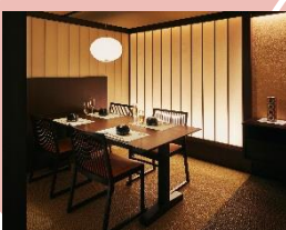
プライベートな半個室の 食事処でゆっくり食事を