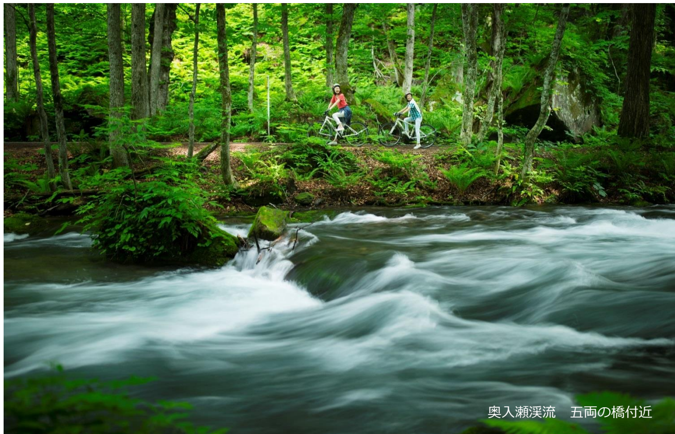
奥入瀬渓流 五両の橋付近

星野リゾート 奥入瀬渓流ホテルでは、2017年5月1日から5月31日まで、新緑の奥入瀬渓流をネイチャーガイドと共に自転車で散策するアクティビティ「溪流ポタリング」を開催いたします。