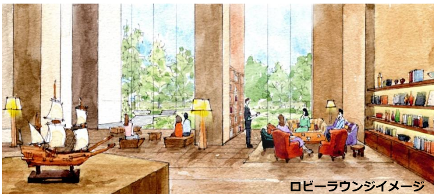
ロビーラウンジイメージ

当館の内装デザインは、商業空間のデザインを数多く手掛けているスーパーポテトに依頼しました。