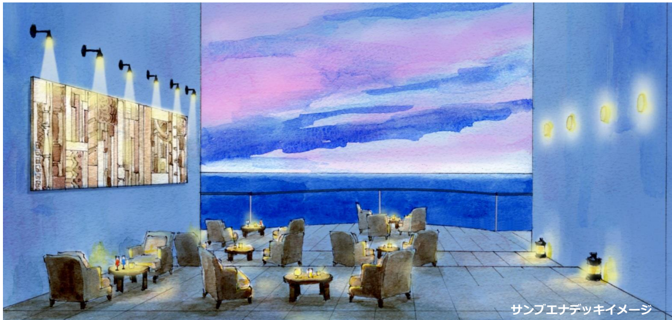
サンベナデッキイメージ

星野リゾートが全国で展開している日本初の温泉旅館ブランド「界」において、2017年4月13日(木)、静岡県伊東市に「星野リゾート 界 アンジン」が開業します。地上8階建て・客室数全45室の新たな施設は、伊東市内で2軒目、界通算14施設目となります。海や船旅に由来するアートな空間で、客室や最上階の大浴場から時間と共に移り変わる絶景のオーシャンビューをお楽しみいただける海沿いの温泉宿です。