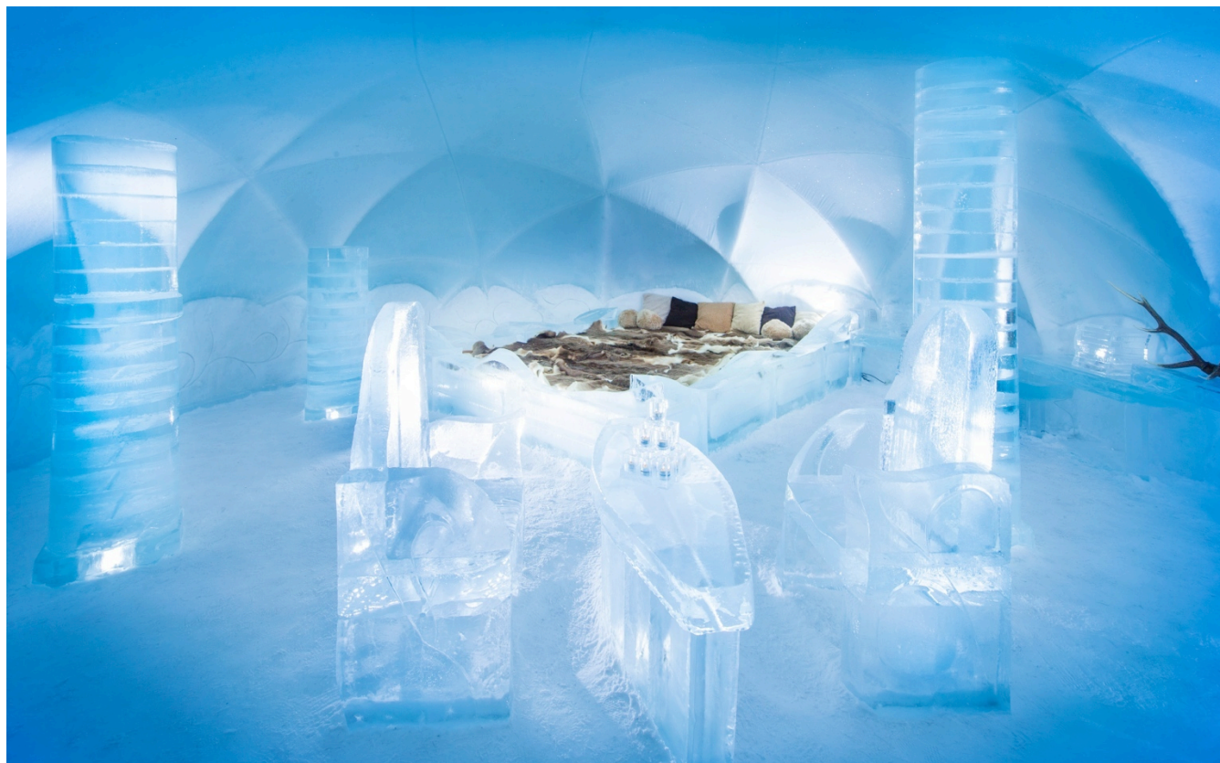
*写真は昨シーズンのものです。

北海道最大級の滞在型スノーリゾート「星野リゾート トマム」では、2016年9月15日より「氷のホテル」のご宿泊の予約受付を開始いたします。氷の街「アイスヴィレッジ」にある「氷のホテル」では、新たに氷に囲まれた露天風呂「アイスインフィニティ」も登場。最低気温が氷点下20度にもなるトマムならではの極寒体験ができるホテルです。