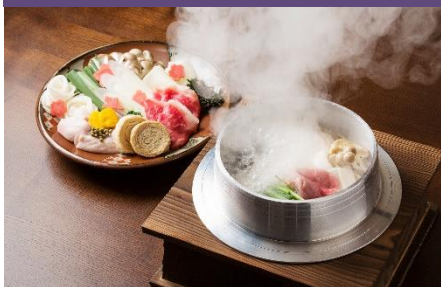
龍王峡の龍神伝説にちなんだ 「龍神鍋」