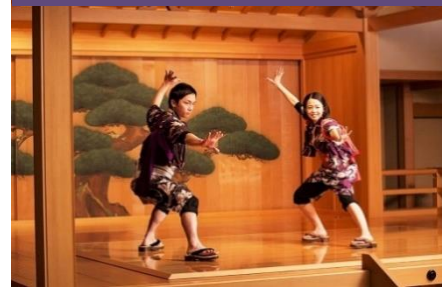
日光下駄の歴史を体験 「日光下駄談義」