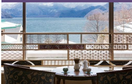
日光伝統工芸に触れる 「組子ライブラリー」