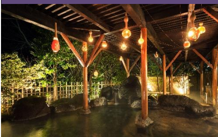
あたたかな光に包まれる 「ひょうたんライトアップ」