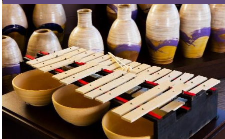
益子焼の陶楽器による演奏 「益子陶琴のうた」