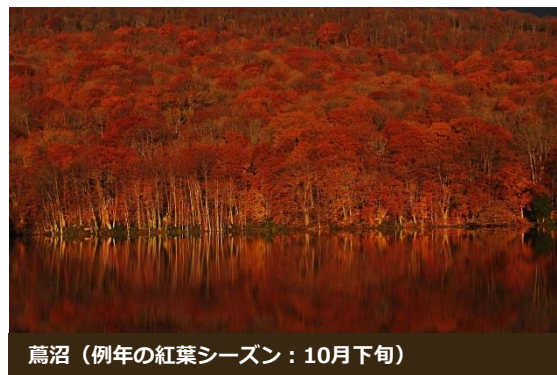
鳶沼 (例年の紅葉シーズン：10月下旬)