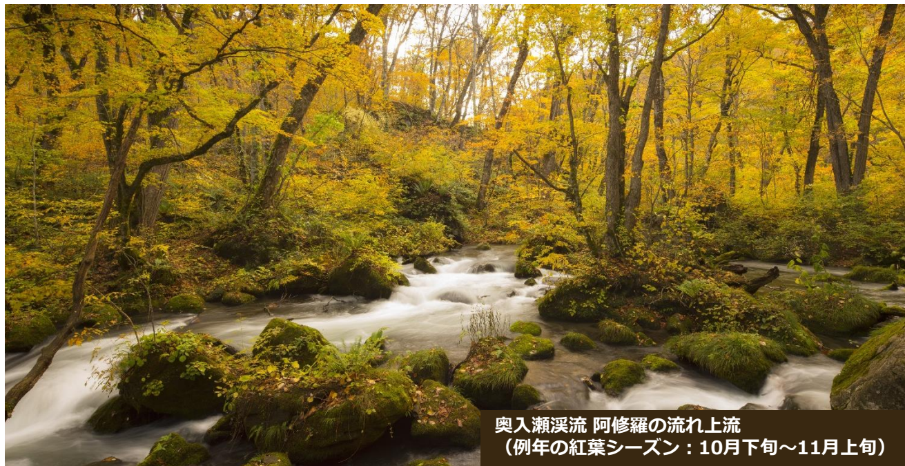
奥入瀬渓流 阿修羅の流れ上流 (例年の紅葉シーズン：10月下旬～11月上旬)

日本屈指の景勝地で紅葉の名所として有名な奥入瀬渓流。星野リゾート奥入瀬渓流ホテルでは、100種類以上の木々が奏でる彩り豊かな奥入瀬の紅葉を、滞在を通して堪能するプログラムを多数ご用意しております。紅葉と渓流が織り成す絶景を愛でるアクティビティツアーや温泉、お食事をお楽しみください。