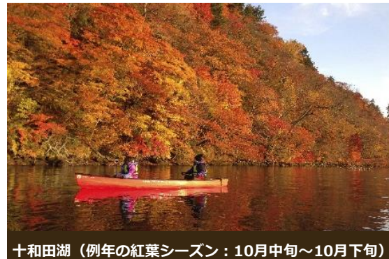
十和田湖 (例年の紅葉シーズン：10月中旬～10月下旬)