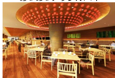
青森りんごキッチン