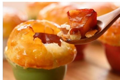
あつあつアップルパイ