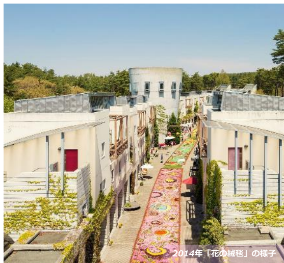
2014年「花の絨毯」の様子

【期間】 4月29日～5月7日、5月14日～6月29日 【プラン料金】 1名30,900円～(2名1室利用) 【プラン内容】 室料+朝食 +プールフリーパス+ハーブティー