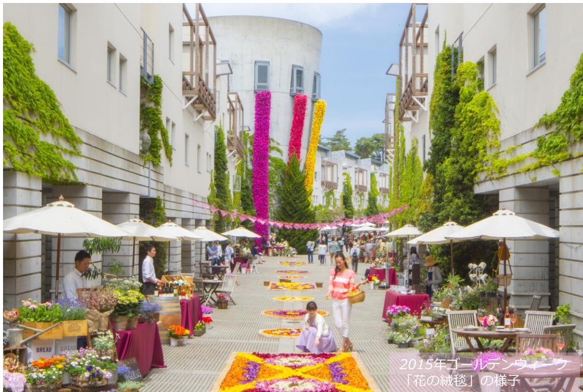
2015年ゴールデンウィーク 「花の絨毯」の様子

八ヶ岳高原に位置するリゾート「星野リゾート リゾナーレ八ヶ岳」では、春の訪れを祝う祭典「花咲くリゾナーレ2016」を開催します。今年で12回目を迎え、シンボルタワーを彩る色鮮やかな装飾や【花の絨毯】春ならではのワインを楽しむ【春のワイン回廊】、八ヶ岳の住人が野菜や花の苗・クラフト作品を持ち寄る【Yatsugatake スプリングマルシェ】など楽しみも色とりどり。人々が集い語らう広場を中心にいつでも賑やかで華やかな空間が広がります。