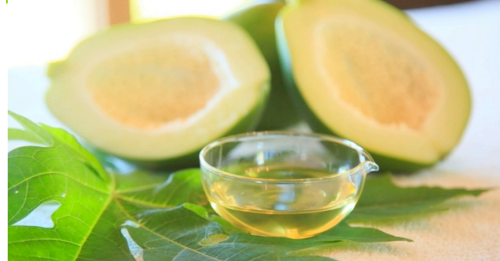
島時間スパの「青パパヤースパ」