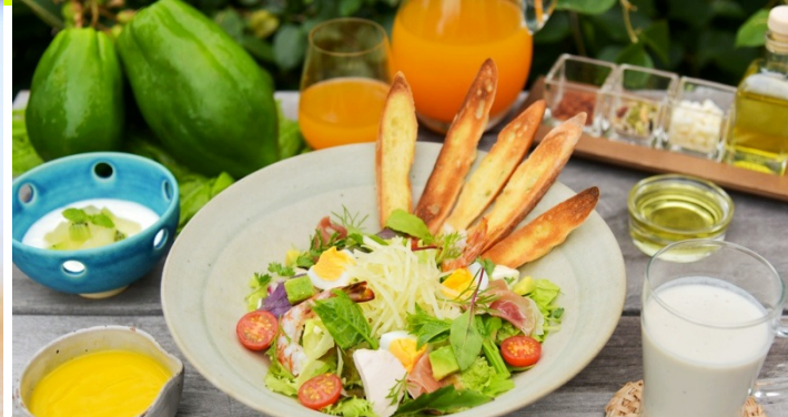
青パパヤー酵素ランチ

酵素の王様と言われ、メディカルフルーツとしても注目されるパパイヤ。そんなパパイヤのパワーをチャージするトリートメントをご用意。スパでは、パパイヤオイルでのトリートメントで調べていきます。イキイキとした状態へと導きます。