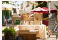
BOOK MARCHÉ -ブック マルシェ-