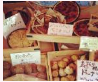
SWEETS MARCHÉ -山のお菓子 マルシェ-

今年も八ヶ岳の暮らしを体験できるテーママルシェを毎週末テーマを変えて開催します。八ヶ岳ゆかりの音楽ライブやナイトマルシェでひんやり過ごしやすいくつろぎの時間をお過ごしください。