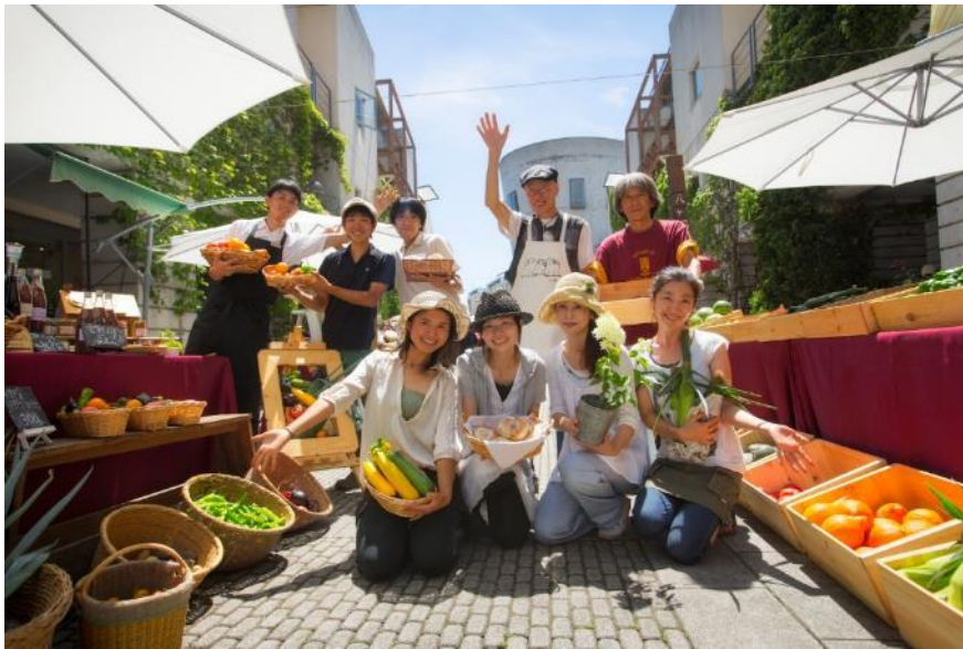
【期間】 7月18日～8月31日 【時間】 9:00～16:00 (荒天中止)

南アルプス連峰、富士山、八ヶ岳を望む雄大な自然に抱かれた、「星野リゾート リゾナーレ 八ヶ岳」。リゾナーレ 八ヶ岳の夏の恒例イベント「八ヶ岳マルシェ2015」が今年で6回目を迎えます。個性豊かな近隣の生産者が八ヶ岳の恵みを持ち寄り、石畳の回廊「ピーマン通り」を賑やかに彩ります。今年のテーマは「野菜×ワインのマリアージュ」。秀逸ワインの宝庫である山梨・長野の県境にあるワインリゾート・リゾナーレ八ヶ岳ならではのマルシェをご用意致しました。夏の恵みとワインの奏でるマリアージュをぜひお楽しみ下さい。