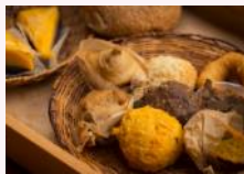
BAKERY MARCHÉ -ベーカリー マルシェ-