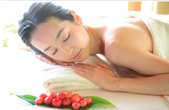
島時間スパの「アセロラスパ」

南国の強い紫外線から実を守るために、自らビタミンCを作り出しているアセロラ。そんなアセロラのパワーをチャージするトリートメントをご用意。スパでは、アセロラのローションでパッティング、その後アセロラ美容液とアセロラのマスクの後にオイルトリートメントで調えていきます。