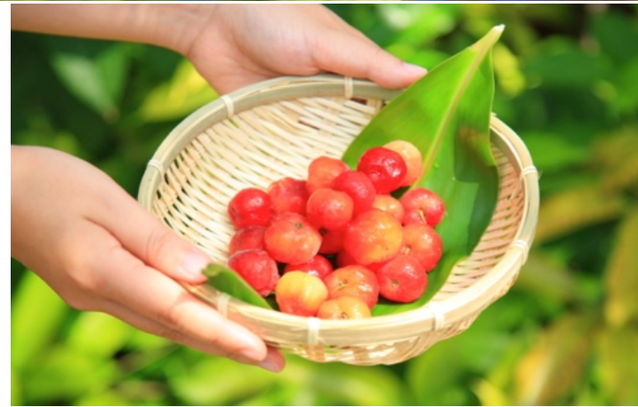
アセロラ収穫&コンフィチュール作り

南国の強い紫外線から実を守るために、自らビタミンCを作り出しているアセロラ。そんなアセロラのパワーをチャージするトリートメントをご用意。スパでは、アセロラのローションでパッティング、その後アセロラ美容液とアセロラのマスクの後にオイルトリートメントで調えていきます。