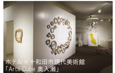
ホテル×十和田市現代美術館 「Arts Cube 奥入瀬」

散策へのアクセスに便利なシャトルをはじめ、アクティビティが多彩。シャトルの朝一便では、溪流のそばで珈琲をいただく「溪流モーニングカフェ」をお楽しみいただけます。