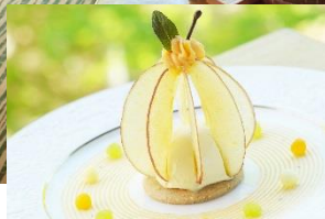
りんごのクリスタル