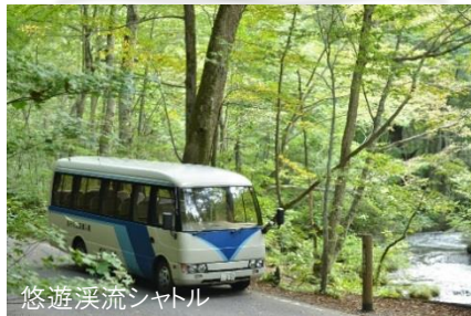
悠遊溪流シャトル

散策へのアクセスに便利なシャトルをはじめ、アクティビティが多彩。シャトルの朝一便では、溪流のそばで珈琲をいただく「溪流モーニングカフェ」をお楽しみいただけます。