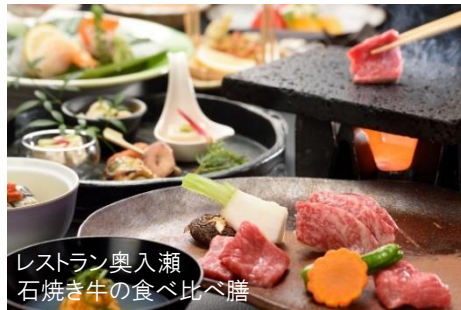
レストラン奥入瀬 石焼き牛の食べ比べ膳