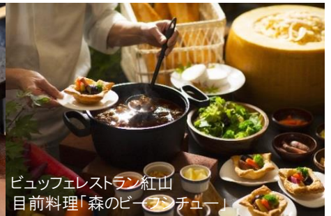
ビュッフェレストラン紅山 目前料理「森のピーチ&チュー」