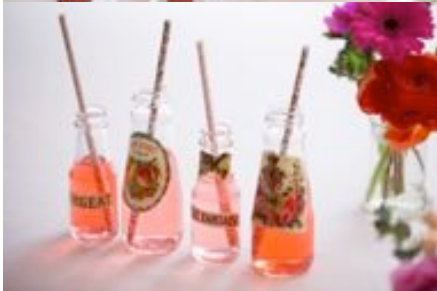
スパークリング・ワインや、ノンアルコールのカクテルもご用意。