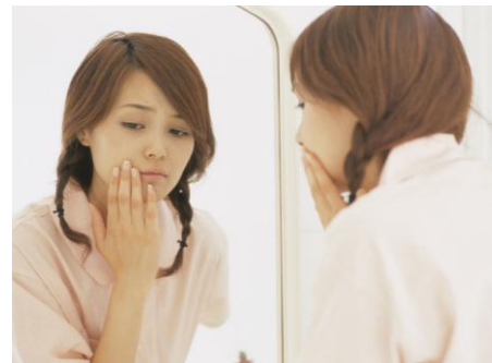
「明るいところで肌を見ると、肌色が暗い気がする」という経験はありませんか？

「肌色が年齢とともに暗くなってきて、以前似合っていた淡い色の洋服が似合わない・・・」、「広告モデルの口紅と同じ色なのに、自分が塗るとくすんで見える・・・」。資生堂のスキンケアブランド「エリクシール」の美白ライン「エリクシール ホワイト」が、女性たちの「肌色」に関する意識調査を実施した結果、「肌色の暗さを感じる」と答えた人は 68%に上りました。(2014 年 12 月 N=300(25～54 歳女性) 資生堂調べ)