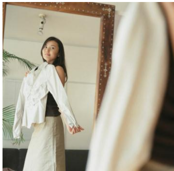
今年流行の白い洋服。「白を着ると色に負ける気がする」という経験はありませんか？

http://www.shiseido.co.jp/elixir/products/eiw/index.html