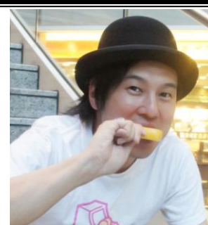
アイスマン福留 (アイスマンフクドメ)

一般的なチョコミントアイスとの一番の違いは、やはりハーゲンダッツならではの脱脂濃縮乳を使用した濃厚なミルクのコクでしょう。 主役であるミントの味を決して邪魔することなく、ミルクの味としっかり一体化されています。ミルクとミントを最良のバランスで組み合わせることで、ミント単体の味わいよりも上品でマイルドな味が楽しめました。