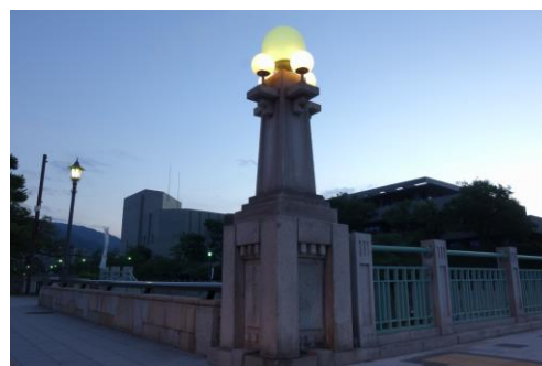
芦屋川近くの街灯