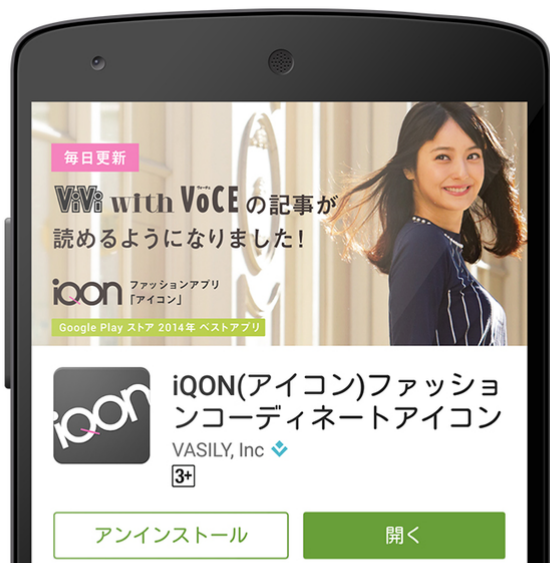
Google Play ストア

https://play.google.com/store/apps/details?id=jp.vasily.iqon&hl=ja