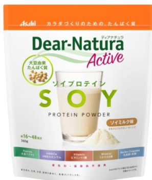
ソイプロテイン ソイミルク味