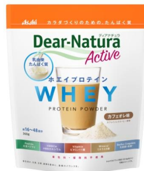
ホエイプロテイン カフェオレ味

サプリメントでおなじみの「ディアナチュラ」ブランド初となる、たんぱく質を手軽に摂取できるプロテインパウダーの新シリーズです。運動時や食事時、就寝前のたんぱく質補給に手軽に利用でき、たんぱく質を含む、全23種の成分がまとめて摂れます。