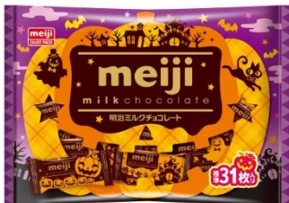
ミルクチョコレート袋ハロウィン