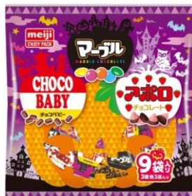
小粒チョコ袋ハロウィン