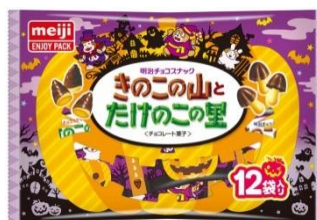
きのこの山とたけのこの里ハロウィン