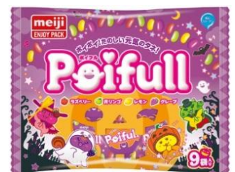
ポイフルエンジョイパックハロウィン