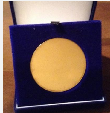
都市鉱山から作成した金メダル