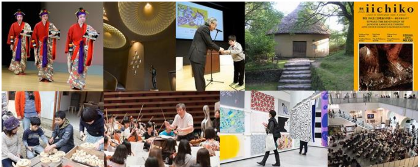
上段左から:沖縄タイムス社「2015年選抜芸能祭」、DIC(株)「DIC川村記念美術館」、三菱地所(株)「キラキラとアートコンクール」、カトーレック(株)「四国村」、三和酒類(株)「季刊 iichiko」 下段:千島土地(株)「みんなのうえん」、トヨタ自動車(株)「トヨタ青少年オーケストラキャンプ」、(株)リクルートホールディングス「クリエイションギャラリーG8」、(公財)東日本鉄道文化財団「駅コンサート」(上野駅)