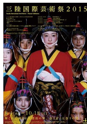
三陸国際芸術祭チラシ