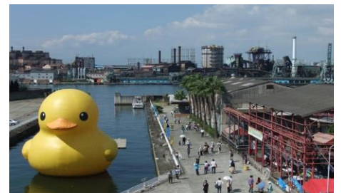
左から：2015年大阪国際会議（協議会主催）、Art Mix Japan（新潟市）、千島土地による名村造船所跡地の活用