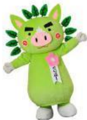
鹿児島県 ぐりぷー