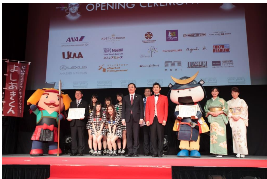
昨年のオープニングで発表された「第三回観光映像大賞」発表の様子。 観光映像大賞(観光庁特別賞):宮城県『仙台・宮城 結び旅』と、 特別賞:愛媛県松山市『マツとヤンマとモブリさん-七つの秘宝と空飛ぶお城-』 より受賞者の方々。