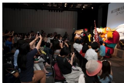
昨年の「第三回観光映像大賞×旅もじゃスペシャルイベント」の様子。