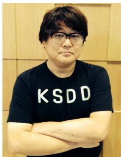
水島 精二 (アニメーション演出家)