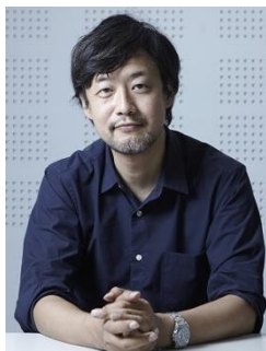
山崎 貴 (映画監督)