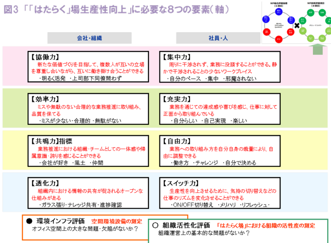
図3 「「はたらく」場生産性向上」に必要な8つの要素(軸)