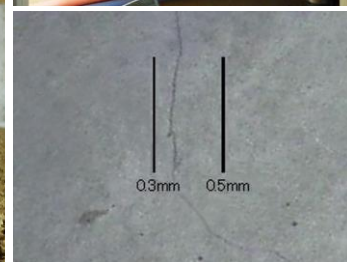
ひび割れ幅を比較計測

「モーグル」は、これまで人間が腹ばいになって潜り込んで行う過酷な作業の床下点検を、人に変わり行うロボットで、LED照明・CCDカメラ・キャタピラーを搭載し、パソコンモニターを見ながらコントローラーで遠隔操作することで、普段見ることができない場所や人が入り込めない狭小空間を隅々まで見ることができます。またパソコンとテレビを接続することにより、配管の状況や基礎部分のひび割れ、シロアリ被害の有無などを、家主も一緒にリアルタイムで確認することもできます。