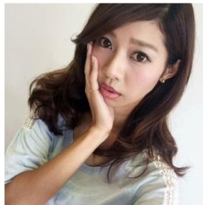
虫歯ポーズ 片手を頬にあてたポーズ。 まるで歯が痛いような状態に 見えることからこの呼び名に。