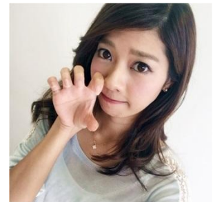
がおーポーズ 片手あるいは両手を ライオンの脚のような形に したポーズ。