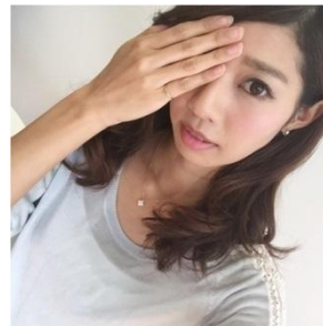
目隠しポーズ 片手で片目を隠すように 覆ったポーズ。 呼ばれ方は様々。