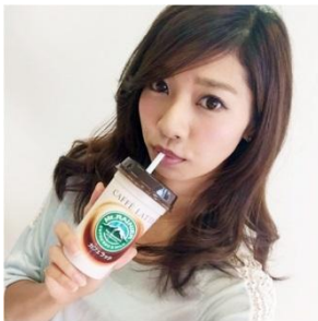
ストローで飲料を飲む ポーズ(ニアチューポーズ) ストローで飲み物を 飲んでいるポーズ。 ストローポーズとも呼ばれる。

はじめに、SNSなどで話題になっている4つの女性の“自撮り”ポーズについて、「かわいい」と思うものはどれかを調べました。“自撮り”は、スマートフォンなどで女性が自分自身を被写体として写したものと定義。調査の対象としたのは、「ストローで飲料を飲むポーズ」を含めた、以下の4つのポーズです。