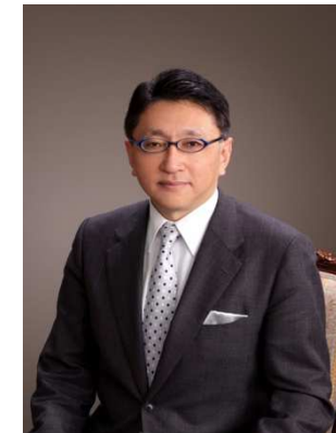
四十万靖 1959年東京都生まれ