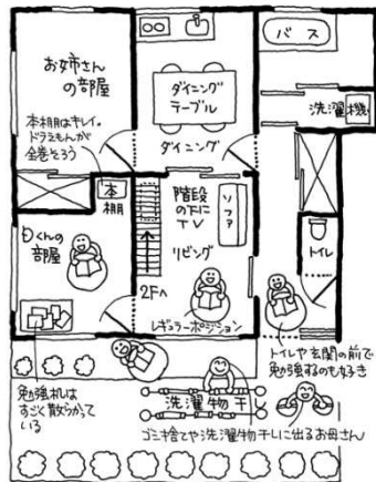
自分で考えた移動机であつちの中あひが学習スペース