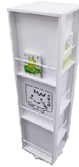
ディスプレイ本棚