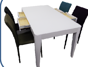
「頭のよい子が育つ」 ダイニングテーブル