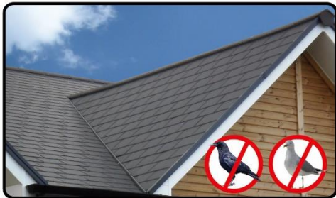
屋根に置いて鳥対策に