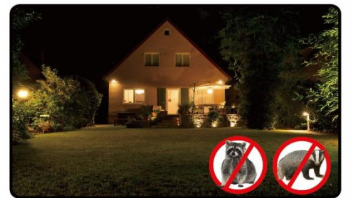
夜間の野生動物対策・防犯対策に