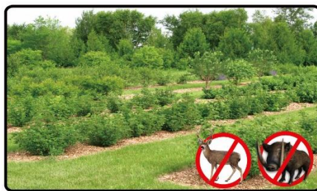
果樹園に置いてイノシシ・鹿・盗難対策に