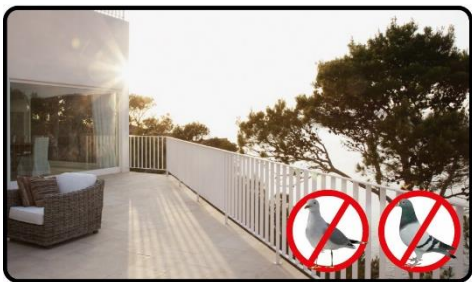
ベランダに置いて鳥のフン害対策に