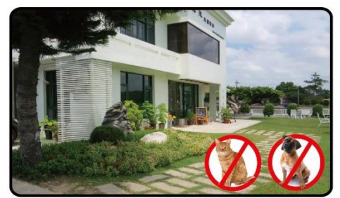
庭に置いて野良猫や野良犬の糞尿対策に