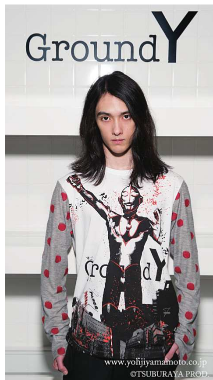
カットソー (ウルトラマン)

Official facebook : Ground Y Official https://www.facebook.com/Ground.Y.Shibuya.PARCO