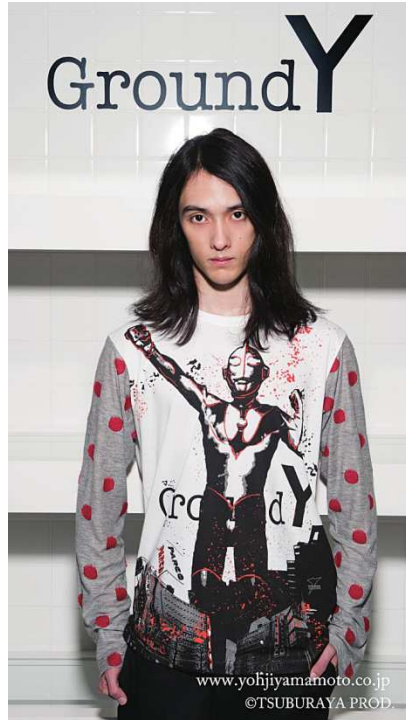
ボーダーカットソー(ウルトラマン)