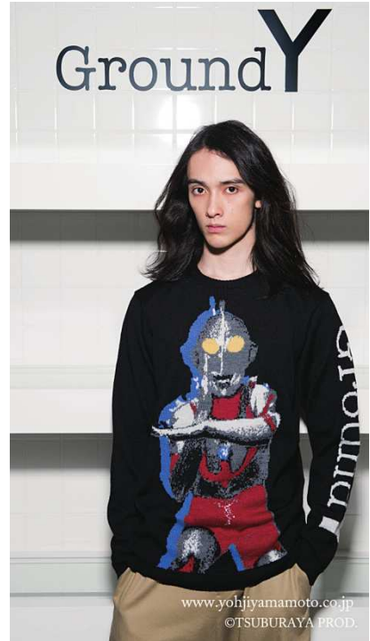
スペシャルニット(ウルトラマン)