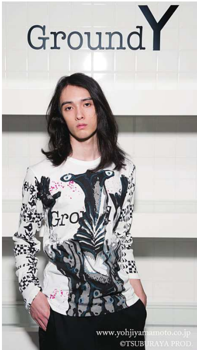
カットソー (ペガッサ星人)