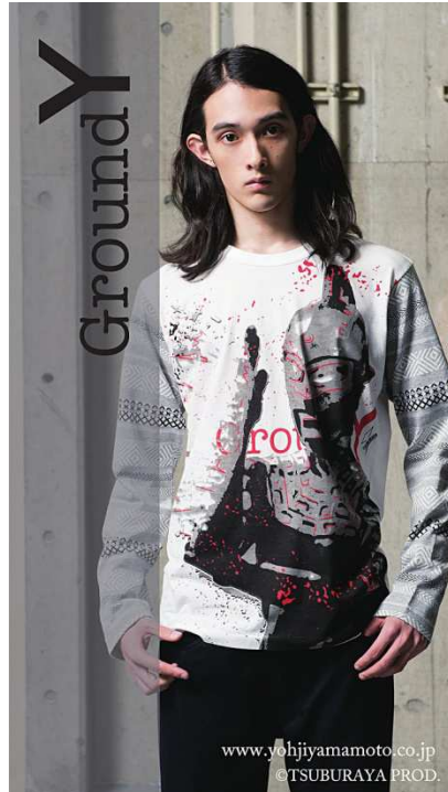
ボーダーカットソー(ウルトラセブン)