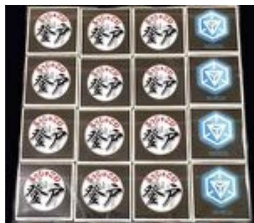
リアルミッションクリアガムのイメージ

報酬の受け方： 3月28日(土)のUSTREAMよっしゃこい登戸放送内にて、cheero Ingress Power Cubeの抽選会を行います。