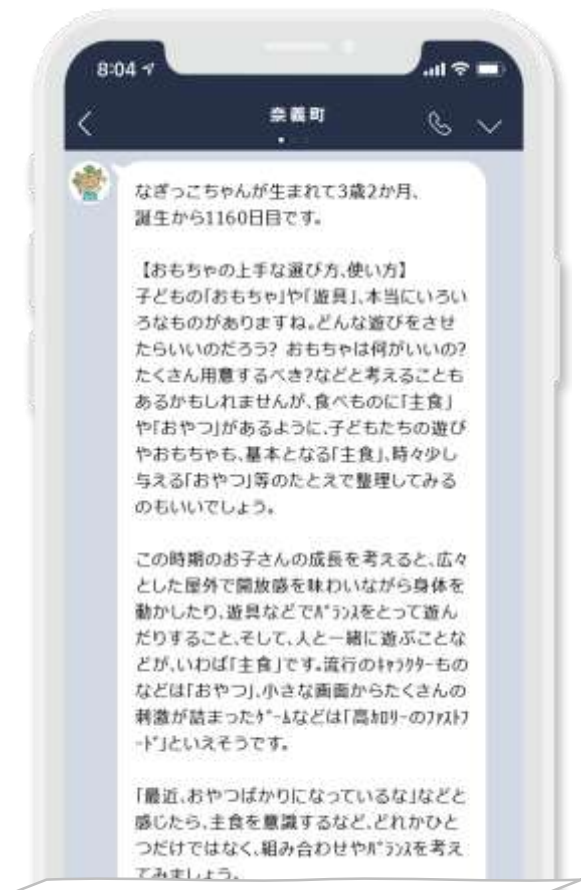
※「なぎっこきずなメール」画面イメージ

「なぎっこきずなメール（メール版/LINE版）」の配信期間は、これまで「妊娠期～3歳誕生日まで」でしたが、小学校入学前までを町としてサポートするため、年長児の3月まで拡充されます。