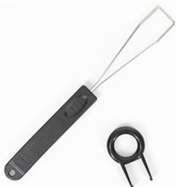
キーキャップ抜き2種