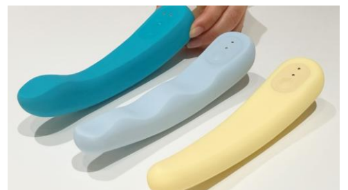
左から、iroha FIT+ AONAMI / iroha FIT みなもづき / iroha FIT みかづき