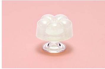
【PLUM】 ぷっくりした膨らみと細かな粒の多彩な刺激