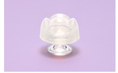
【LILY】 角度の違う凸凹でつくような刺激