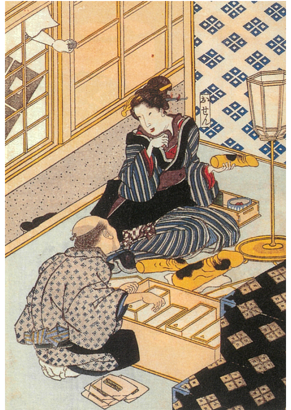
図：田中優子『張形と江戸女』より歌川国貞「春情妓談水揚帳」

参考文献：レイチェル・P・メインズ著、佐藤雅彦訳『ヴァイブレーターの文化史』（論創社、2010）田中優子著『張形と江戸女』（ちくま文庫、2013）