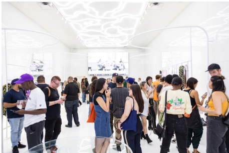
Flagship Storeオープニングパーティの様子

アメリカでは日本と同時のタイミングでコラボレーション製品第二弾を発売。ロサンゼルスでは2018年8月24日に初のFlagship StoreをOPEN。初日は大行列のなか700名のファンが来店し盛り上がりを見せました。前日の8月23日にはファッション、スケート関係のゲスト約150名を招待したパーティを開催し、盛況のうちに終了しました。