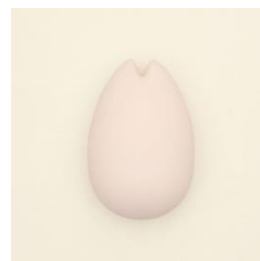
商品名：iroha ひなざくら 参考価格/税抜：5800円