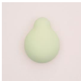
商品名：iroha はなみどり 参考価格/税抜：5800円