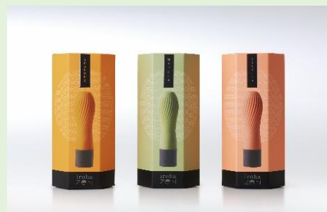
iroha zenパッケージデザイン

自社で2017年11月に調査したデータによると、セルフプレジャー・アイテムを使ったことがない女性は約63%です。まだ使ったことがない女性にも手にとっていただきやすいように、お菓子のように可愛いパッケージデザインにいたしました。