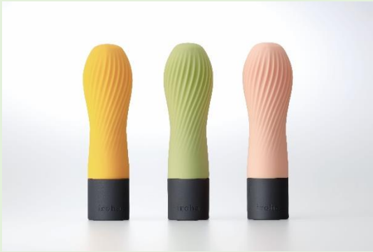
【ゆずちゃ】 【まっちゃ】 【はなちゃ】

繊細な凹凸のプリーツと、取り回しやすいスティックタイプで回しあてがったり、くすぐったり、なぞったり多彩な刺激を味わえます。 水深50cmまでOKの防水設計なのでお風呂でもお楽しみいただけます。