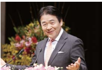
竹中平蔵・慶應義塾大学教授が指導し、グローバルリーダーを育成する「竹中平蔵 世界塾」