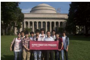
東京工業大学・広瀬茂男名誉教授と取り組む「スーパーロボティクスプログラム」。 写真はMIT・ハーバード研修にて。他多数