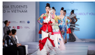
SAKURA COLLECTION ASIAN STUDENTS AWARDS in ベトナム の様子