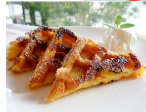
▲ デザートワッフル(上から) 「ミックスベリー」「フレンチワッフル」:各550円