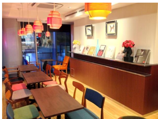
▲ R.L WAFFLE CAFE グランブルー店(東京駅)

◆R.L WAFFLE CAFE 詳細 http://www.rl-waffle.co.jp/wafflecafe.html