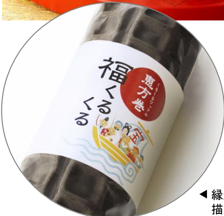
◀縁起の良い七福神を描いたパッケージ。