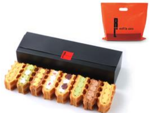
▲ シックな墨色のパッケージ