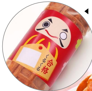
◀「だるま」と「絵馬」を描いたパッケージ。願い事や応援メッセージを書き込めます。