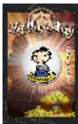
長崎県内各エリアに実際に隠される宝箱 / 発見者賞の「ながさき龍馬くん」バッジ(計7種)