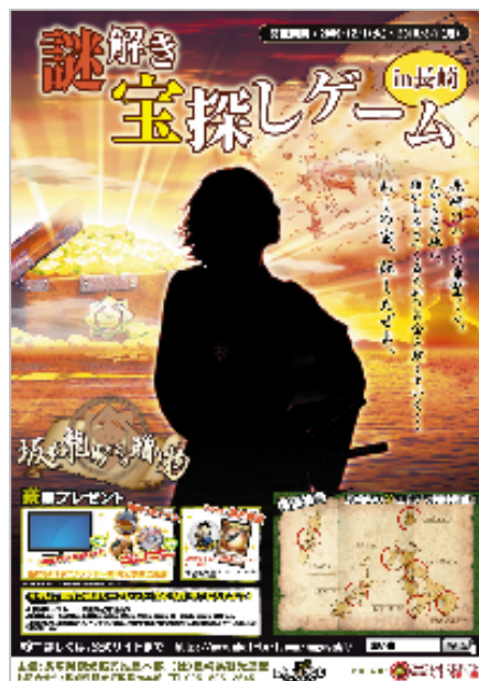
イベントポスター